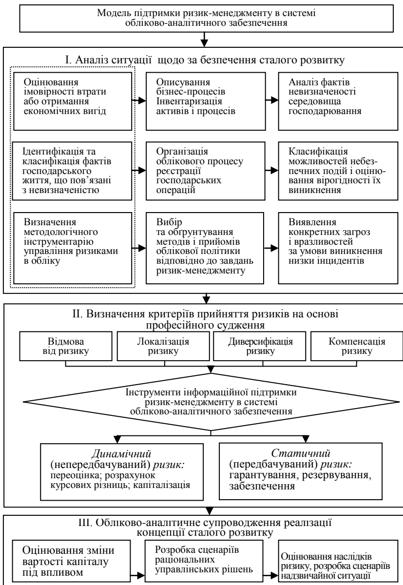
Рис. 1. Модель обліково-аналітичного забезпечення ризик-менеджменту на основі концепції сталого розвитку