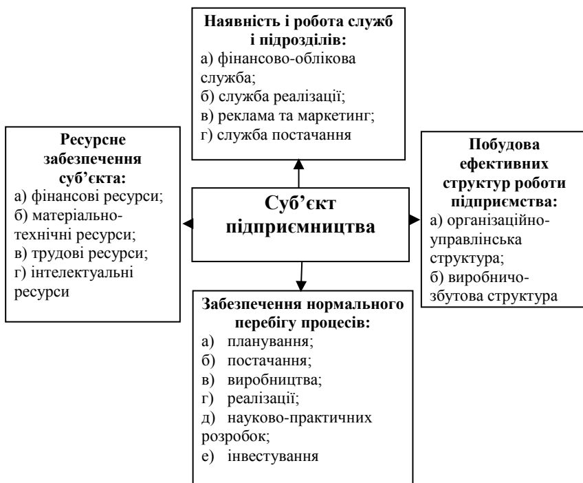
Рис. 2. Внутрішнє коло фінансової безпеки суб'єкта господарювання

золотовалютного запасу; низький рівень інвестиційної діяльності; неефективність податкової системи; недосконалість бюджетної системи, надмірні державні витрати та дефіцит державного бюджету; високий рівень інфляції; зростання тіньової економіки; необґрунтована підтримка курсу національної грошової одиниці; платіжна криза; значна заборгованість у виплаті заробітної плати, пенсій та інших соціальних виплат; неповноцінність фондового ринку; нерозвиненість страхового ринку; слабкість банківської системи; зростання внутрішнього боргу країни (рис. 2).