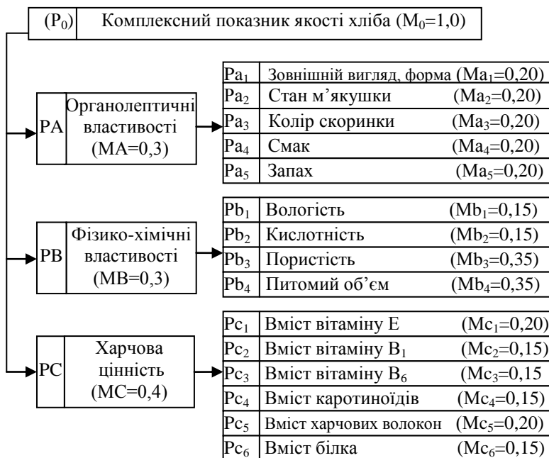
Рис. 2. «Дерево властивостей» для визначення комплексного показника якості хліба